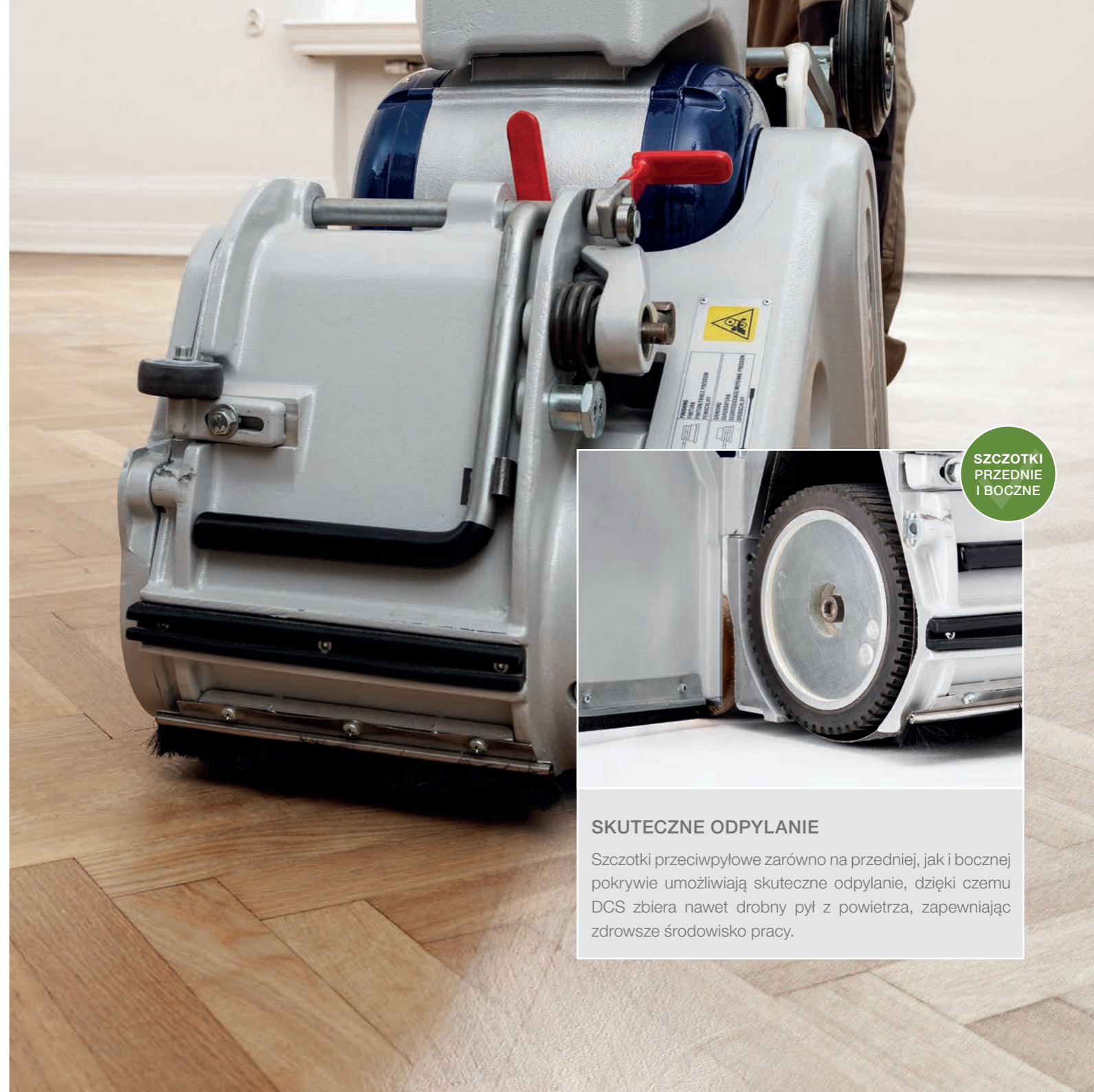
SZCZOTKI PRZEDNIE I BOCZNE

Zintegrowane złącze umożliwia podłączenie urządzenia do wszystkich możliwych systemów odpylania, takich jak Bona DCS 70, DCS 25, a także standardowych i jednorazowych worków na pył. Przy użyciu tego złącza wszystkie te opcje są łatwe do zastosowania i mogą być używane bez zbędnych modyfikacji.